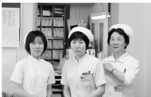
いつも笑顔が素敵な眼科外来看護スタッフ

などとなっています。また、頻度は少ないですが、腫瘍性疾患や涙囊炎などもみられます。手術をしない疾患としてはブドウ膜炎、視神経炎、移植後拒絶反応などがあります。年齢は各世代を網羅していますが高齢者が中心でそれだけに色々な基礎疾患を持っている方が多く、内科など他診療科との連携が今後ますます重要性を増すものと考えています。(眼科)